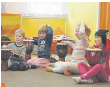
Víte, že bubnování rozvíjí rytmus?

Přibližně 100 dětí se postupně zapojilo do čtyř interaktivních hudebně pohybových dílen. Malí muzikanti popustili uzdu fantazii při naslouchání nejrůznějším hudebním nástrojům a nechali na sebe působit jejich zvuky. Sami se pak zapojili do divokého bubnování, tancem vyjádřili tahlé tóny fujary a nakonec si