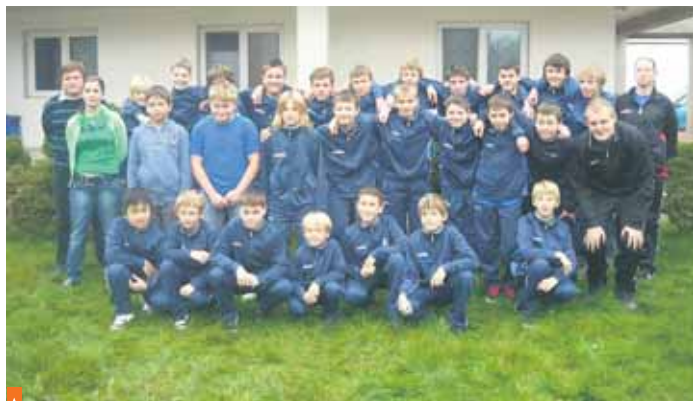
Za loňskou sezónu je třeba pochválit velké i malé