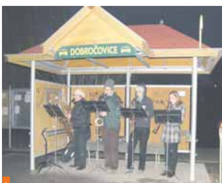
Netradiční místo i skladby