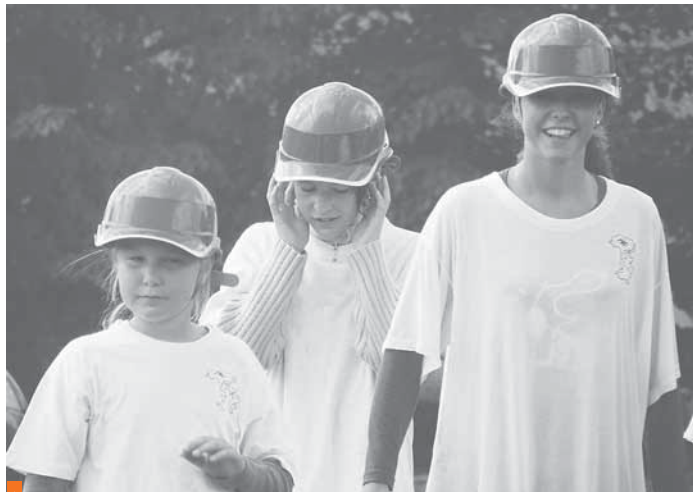
Mladí zatím spí na vavřínech. Pomůže soustředění k jejich probuzení?

Polepští diváci byli po dlouhá léta navykli sledovat zápasy svého týmu se soupeři z nejnižších tříd. Pro postup mužstva o stupněk výš, do okresního přeboru v sezóně 2001/2002, byl více než vítanou změnou. O čtyři sezony později, na jaře 2006, klub znovu postupuje. Tentokrát už do krajské soutěže, jenomže v letech 2006–2010 platila v polepském fotbale zásada, nikde se nezdržet příliš dlouho! Jedna postupová radost, za rok druhá, za další rok třetí. Nenudím Vás? Před dvěma lety na hřišti Sokola Brozany nastoupili hráči Polep ke své premiéře ve fotbalové divizi. Úvodní zápas se výsledkově sice nepovedl, ale první divizní sezona zakončená sedmým místem byla na nováčka slušným výkonem. Kdybyste po postupu do okresního přeboru Polepským předpověděli, že za deset let na tom samém hřišti uvidí hrát domácí tým s rezervními mužstvy prvotřídního Hradce Králové a Jablonce, patrně by si o Vás mysleli své. Jak se polepskému „A“ mužstvu daří v současné sezóně 2011/2012? Podzimní bilance