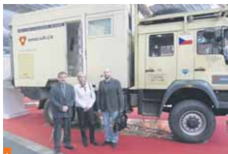
Na veletrhu domluvili zástupci Kolína i podrobný program Worldfilmu