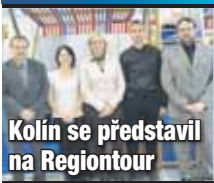
Kolín se představil na Regiontour