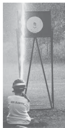
a dívky z Klučova. Navíc Kosteláci si s Klučovskými museli navzájem vypůjčit své „koně“

KLUČOV – Téměř třicet dorostenců a dorostenek se sjede do místní sokolovny. Cílem je společný trénink, ale i vědomosti.