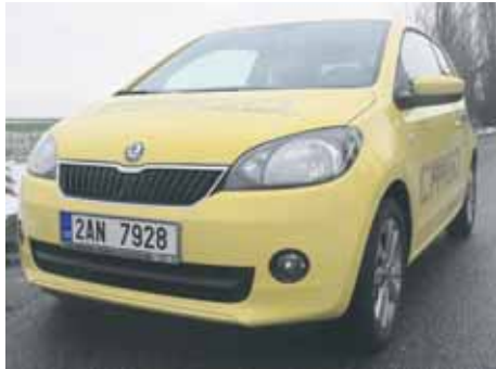
Citigo na první pohled zaujme neotřetým designem

dobrý. Vůz patří ve své kategorii bezesporu ke špičce a do rodiny se hodí jako druhý nebo třetí vůz, posloužit ale může i firemním účelům. Jako městský vůz může vyhovovat jak mladým začínajícím řidičům, tak starším manželským páram, které ho občas vyvezou na výlet za město. Pro maminky, které potřebují poutat své