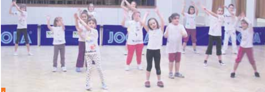
Ačkoli měly děti trému, tančování před publikem si užívaly