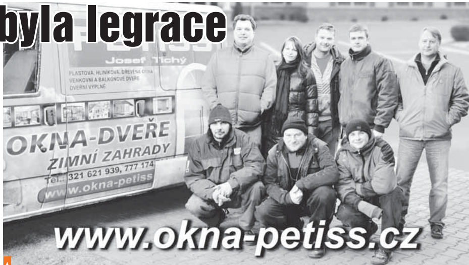
▲ Základem prosperující firmy je dobrý team. A ten firma Petiss má

■ Mluvíte často o českých výrobcích. Proč? Naše přesvědčení je, že „Prodejem českých výrobků podporujeme českou ekonomiku“. Bereme to trochu jako „Národní obrození“.