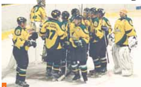
Brankář je v hokeji poslední instancí, která může výrazně ovlivnit každý zápas, proto se k němu sjíždějí hráči a nejen ho povzbuzují, ale i gratulují, jako v tomto případě.