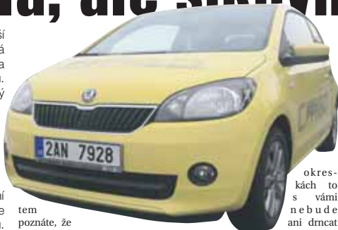
okreskách to s vámi ne b u d e ani přehnaně houpat. Jako jediný vůz v segmentu malých vozů má aktivní bezpečnost, výrazně posle-

...taková je nejmenší škodovka Citigo, která se poprvé představila na podzim minulého roku. Designéři vsadili na neokázalý a minimalistický styl, zapomeňte proto na kulaté tvary a světlometry ve tvaru očí. Citigo zaujme rovnými až strohými liniemi a jako šperk mu sluší inovované logo Škody, které už není stříbrné na zeleném, ale ocelové na černém podkladu.