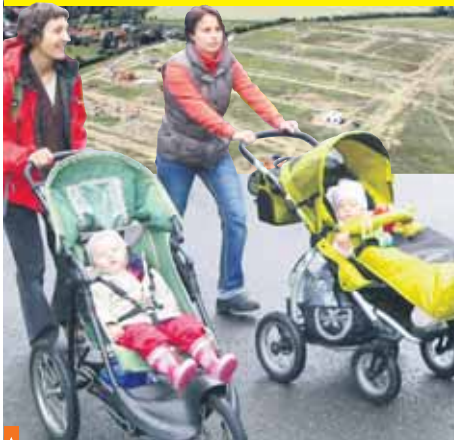
Podle předběžných výsledků Sčítání lidu, domů a bytů 2011 byl Střeďočeký kraj s počtem obyvatel 1 274 633 nejlidnatějším krajem v republice. Během posledních 10 let se lidé stěhovali nejčastěji do regionů v zájmu Prahy, ubývá domácností, které vytápí uhlím, rapidně narostl počet připojení k internetu, počet vysokoškolsky vzdělaných se zdvojnásobil. Nejvyššího relativního přírůstku bytového fondu dosáhly Květinice a Nupaky na Říčanskú

Sčítání v r. 1869 = 979 tis. + + + = 1 275 tis. v r. 2011