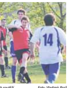
Registrace se týká i fotbalistů z okresních soutěží.

Navíc, jak dodává generální sekretář FAČR, na projektu komplexního sčítání lidí v českém fotbalu závisí i klíčová jednání na ministerstvu. „Vytváří se nový systém financování sportu a ministerstvu pochopitelně záleží na tom, aby znalo přesná čísla. Myslím, že v krátké době čeká „sčítání členů“ i ostatní sportovní odvětví. A stane se výhodou fotbalu, že bude jedním z prvních, kdo nabídnou přesná čísla. I z toho důvodu bych ještě jednou všem, kdo se na tomto náročném projektu podílí, rád velmi poděkoval,“ děkuje Řepka.