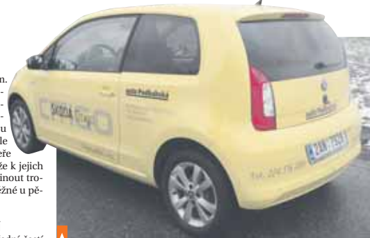
Citigo na první pohled zaujme neotřelým designem

nu brzdovým asistentem. Pokud tedy v popojždějí koloně nestačíte zabrzdit, auto za vás automaticky před překážkou zastaví samo. Na vozidle jsou výrazné velké dveře a počítat musíte s tím, že k jejich zavření člověk musí vyvinout trochu větší sílu, nežli je běžné u pětidveřových modelů.