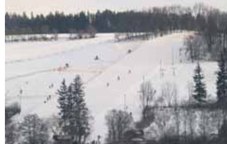
Takhle vypadá lyžařský areál loni na Silvestra. Letošní sezona zatím lyžařům v nížních nepříje a tak se bohužel stále jen čeká na mráz i sníh

Dva paralelní vleky typu „POMA“ s teleskopickými unášecí (délka 300 a 280 m, převýšení 50 m) a malý dětský vlek (délka 120 m). Mírné sjezdové tratě v areálu jsou vhodné hlavně pro začínající a středně pokročilé lyžaře. Protože přírodního sněhu nebývá v této lokalitě (nadmořská výška 350 – 400 m) dostatek, je tu velmi výkonný zasněžovací systém a pomocí šesti zasněžovacích děl lze vyrobit sníh. Sníh. Je k tomu zapotřebí pouze mráz. Na minimální výkon lze systém spustit cca od -3 °C, dále záleží na vlhkosti vzduchu, směru a intenzitě větru apod. Sjezdovka se denně upravuje, vleky jsou v provozu 12 hod. denně, od devíti ráno do devíti večer – svah je vybaven osvětlením, které umožňuje večerní lyžování. O novinkách pro letošní sezonu jsme hovořili s jedním z majitelů Janem Němečkem. Je už známo a jediné lyžařské středisko ve Středoečeském kraji, jaká byla v minulém sezoně průměrná návštěva ve všední dny a jaká o víkendech? Přesné počty návštěvníků nezná-