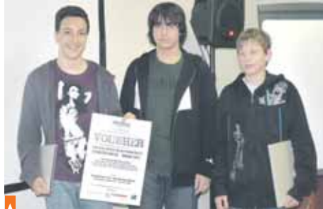
Vítězné družstvo soutěže Vandr 2011 je z 1. ZŠ Říčany