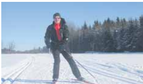
Je mnoho hledisek, která budete při výběru vhodných běžeckých lyží brát v úvahu. Určitě to však bude způsob běhu (klasika či bruslení), terén (upravený či neupravený), fyzická zdatnost a cena vybavení