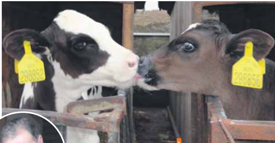
František Mikoláš udržuje v rodině tradici farmaření

Mlékomat je umístěn vedle krávy a je jediným takovým zařízením na Benešovsku. Další „nejbližší“ jsou v Praze. Nebude tak asi žádným překvapením, že zde můžete narazit na zájemce o tuto bílou tekutinu skutečně z velmi širokého okolí. Ochutnáte-li čerstvé mléko, nejspíš se pro něj vrátíte a vracet budete. Soubor chutí s mlékem krabicovým či v PET láhvičích totiž hravě vyhrává.