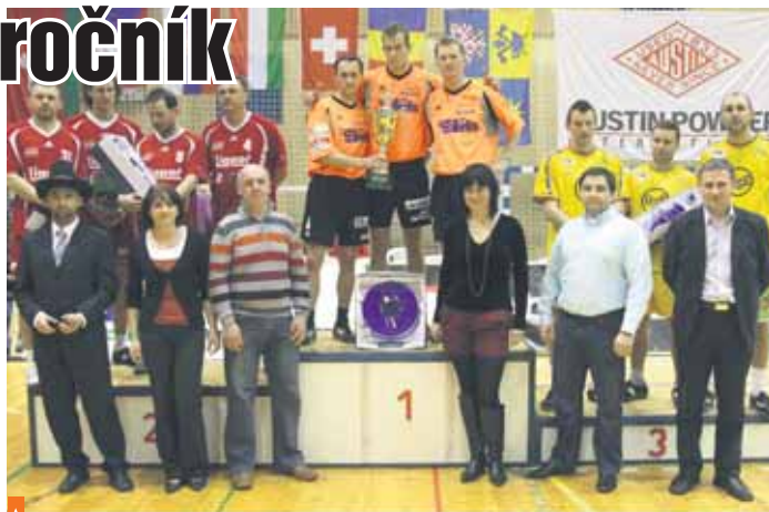
Velká vítězství i zklamání zažili hráči benešovského Šacunagu v letošním nohejbalovém ročníku