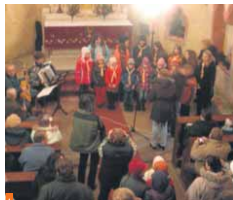
Rozezpívání v kostele sv. Václava na Chvojinku