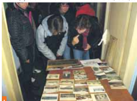
Výstava starých pohledů a fotografií byla zajímavým ohlédnutím za dobou dávno minulou