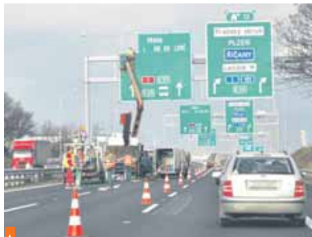
Most otevřen, cesta pro kamiony na Říčany volná. Jenom těch cedulí je nějak moc. Co říkáte?

stavební dokumentace, atesty atp.) a v sobotu na staveništi samotném i v nejbližším navazujícím okolí (náhrada prozatímního dopravního značení za nové, už definitivní, odstranění značených dočasných objízdek, vyvěšení nových jízdních řádů...). Od soboty se tedy na mostě jezdí už v novém režimu. O dva týdny dříve, než byl původně stanovený termín dokončení, vyhlášený při zahájení prací (22. 12. 2011). Silnici II/101 převádí přes dálnici a dva kolektorové pásy připojovacích pruhů. Jeho délka je 98,80 metru, šířka průjezdného prostoru pro vozidla na vozovce se zvětšila na 9,50 metru, šířka mezi zábradlími pro vozovku a chodníky má 10,75 metru. Konstrukce podstoupila nutnou zatěžovací zkoušku