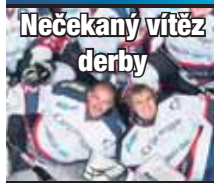
Nečekaný vítěz derby