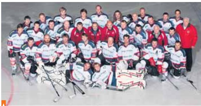
Vítězné derby hokejistů HC Jesenice