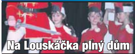
Na Louskáčka plný dům