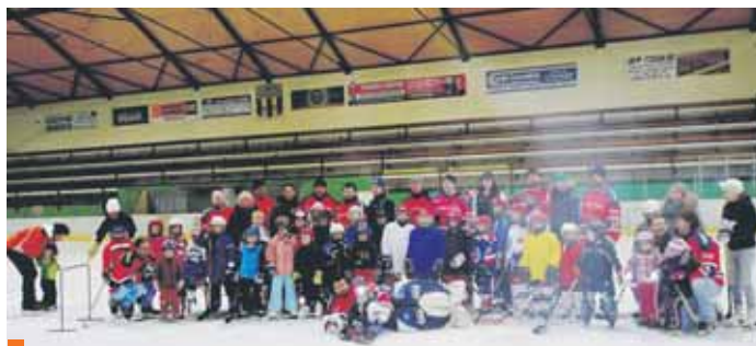
Hromadné foto nemohlo chybět, i když mnohdy jen stání na bruslích činilo potíže