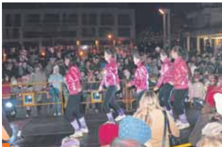
Strom splněných přání byl také letos věnován Dětskému domovu v Pyšelicích. Dárky, které po střechu zaplnily velké auto, byly předány Dětskému domovu 17. prosince