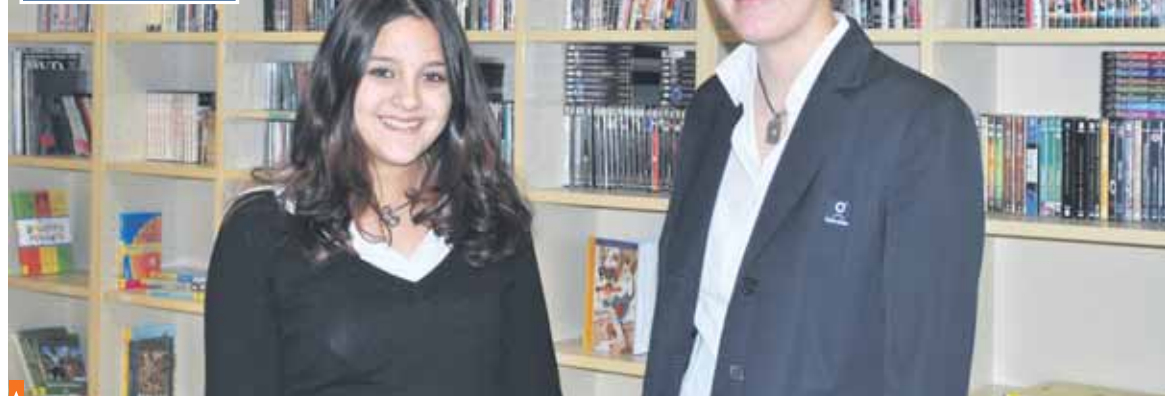
Startovací dráha pro mladé tryskáče – i tak se dá nazvat gymnázium Open Gate v Babicích u Říčan. Mladí piloti svých soukromých strojů vědí, že jen na nich záleží, jak vysoko a daleko s nimi doletí. Podmínky mají v Open Gate špičkové