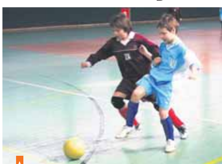
Mládežnické fotbalové turnaje mají vždy vědně hlediště, táty, mámy, dědy, kteří fandí

Svědčí o tom přihlášky nejen okolních celků jako Babčice, Mnichovice, Ondřejova, Dobřevoje, Jesenice, Kostelec nad Černými lesy, ale i ze vzdálenějších míst jako z Kolína, Berouna, Neratovic či Příbrami. Jedná se o mini přípravy, starší přípravy, až po žákovské kategorie. Tedy fotbalové mládí, které potřebuje nejen trénovat, ale především hrát. Ideálním, i když neplnohodnotně vybaveným místem k tomu, je říčanská Sportovní hala, která týden co týden hostí