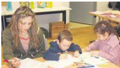
Hlavní přednosti Základní školy Eliáš? Nízký počet dětí ve třídách, kvalitní pedagogové, moderní zázení, sportoviště, ale i výchova k tradičním hodnotám a křesťanství.

Pane řediteli, jak je možné, že například v Americe všichni špičkoví vědci věří v Boha a ve stvoření světa a zároveň chápou a přebírají poznatky moderní vědy?